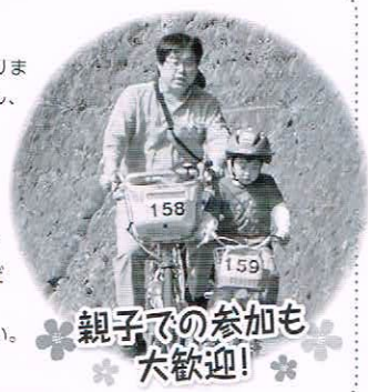
親子での参加も大歓迎!